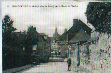
Doudeville Arrivée dans le Bourg par la route de Veules